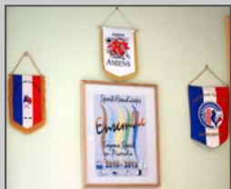
Le club a, obtenu, en 2010, le label « Sports Handicaps »

Une équipe sympathique et dynamique est là pour vous recevoir et vous apporter les conseils qui vous sont nécessaires.